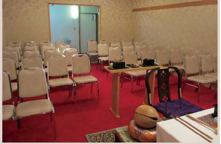
■ ご法要会場：北館1階（室料：37,800円、ご住職様控え室を含みます）